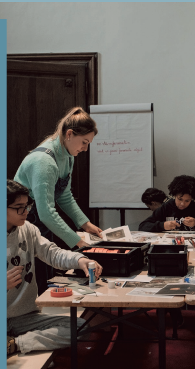
Erkenningsnummer werving en selectie VG 206/B-BHG B-A404.008 W.RS.98 • lid van Federgon