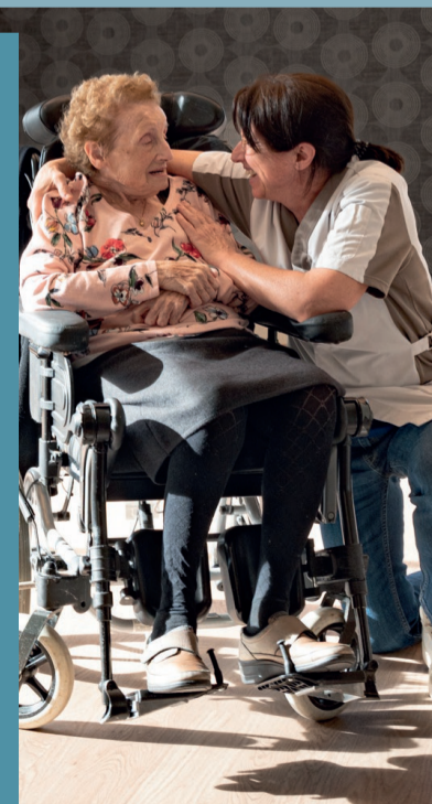
Erkenningsnummer werving en selectie VG 206/B-BHG B-AA04.008 W/RS.98 - lid van Federgon

Deze rekrutering verloopt in exclusief contract met HUDSON