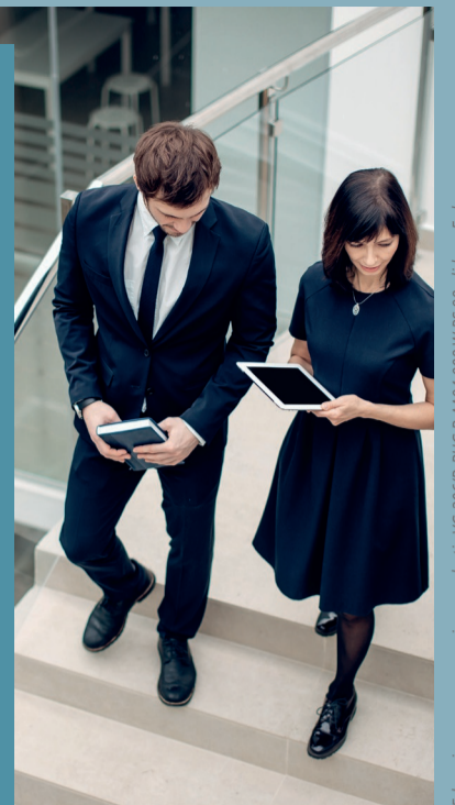
Erkenningsnummer werving en selectie VG 206/B-BHG B-AA04.008 W.RS.98 • lid van Federgon

Deze rekrutering verloopt in exclusief contract met hudson