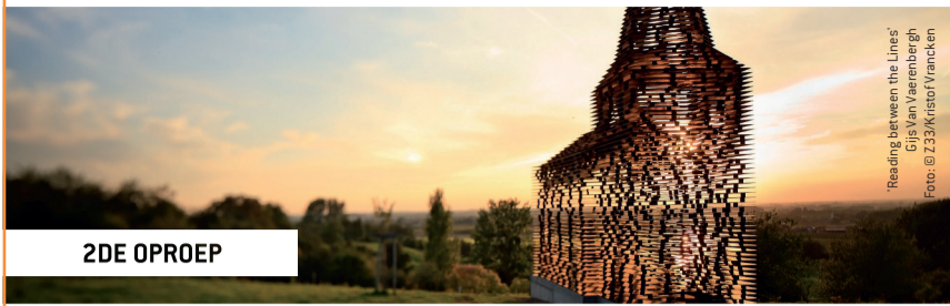
Reading between the Lines Gijs Van Vaerenbergh