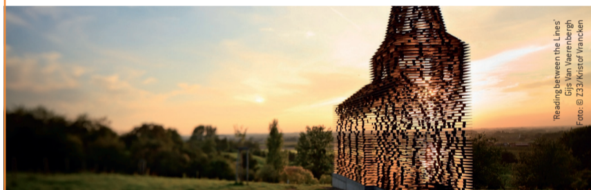
Reading between the Lines Gijs Van Vaerenbergh