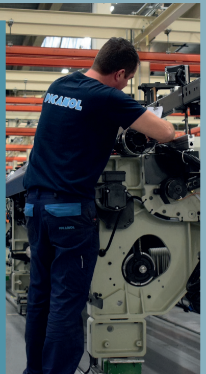
Erkenningsnummer werving en selectie VG 206/B-BHG-B-AA04.008 W.RS.98 • lid van Federgon

Deze rekrutering verloopt in exclusief contract met hudson