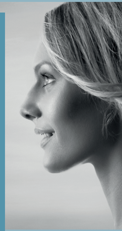
Erkenningsnummer werving en selectie VG_2006B-BHG B-AA04.008 W-RS-98 • lid van Federgon

Deze rekrutering verloopt in exclusief contract met hudson